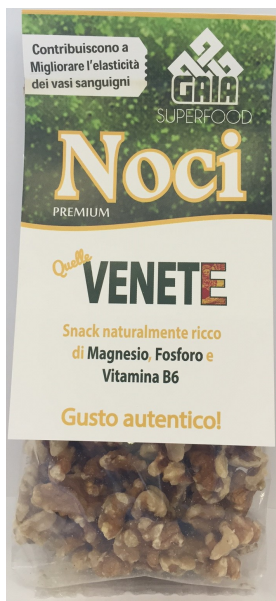
Confezione vista frontale